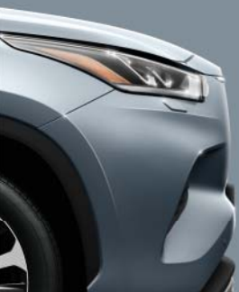
1K5 Moondust Silver*