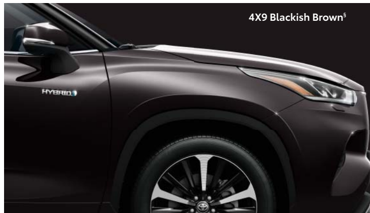
4X9 Blackish Brown §