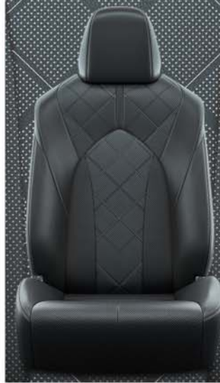
Zwarte geperforeerde lederen bekleding met structuur (LA20) Standaard voor Premium