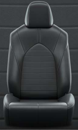
Zwarte kunstlederen bekleding (EB20) Standaard voor Style