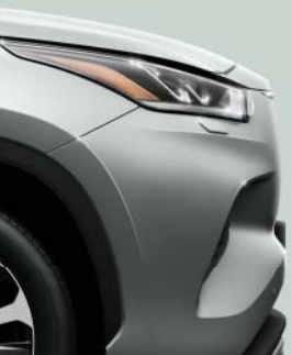
1J9 Celestial Silver §