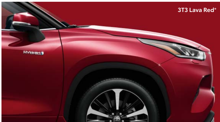
3T3 Lava Red*