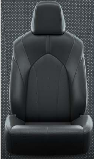
Zwarte geperforeerde lederen bekleding (LB20) Standaard voor Executive