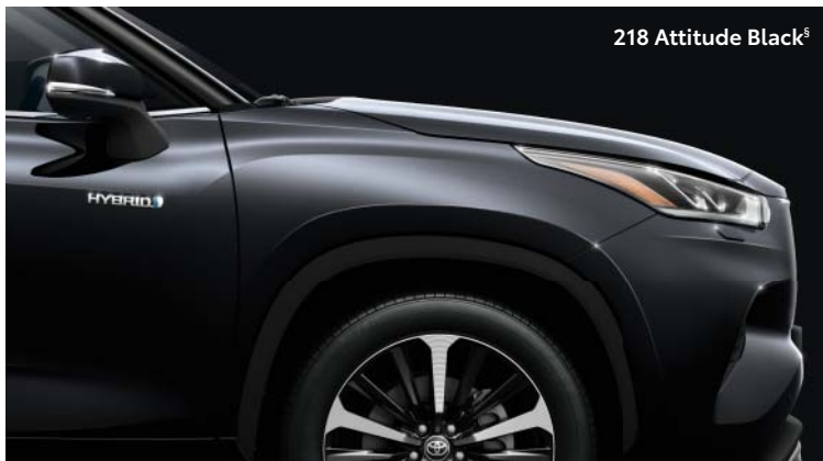
218 Attitude Black §