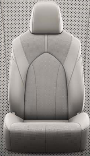
Grijze geperforeerde lederen bekleding (LB10) Optioneel voor Executive