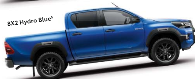
8X2 Hydro Blue §