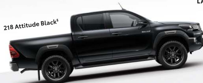
218 Attitude Black §