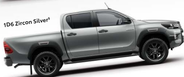
1D6 Zircon Silver §