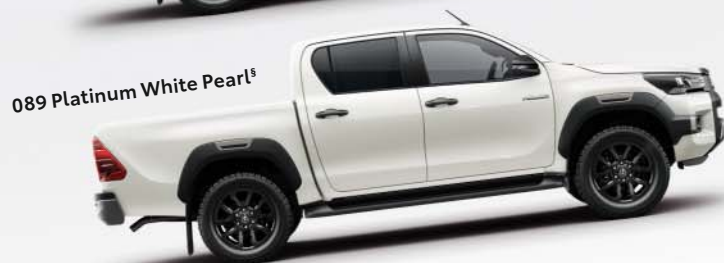
089 Platinum White Pearl §