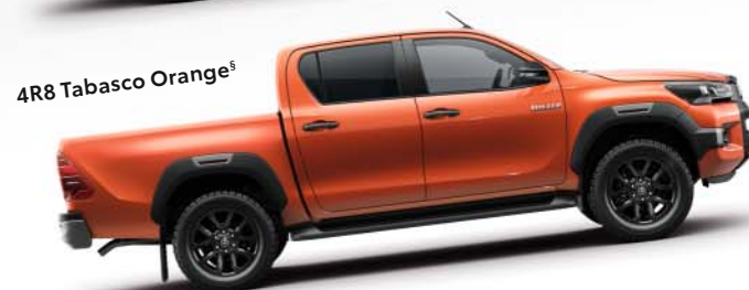
4R8 Tabasco Orange §