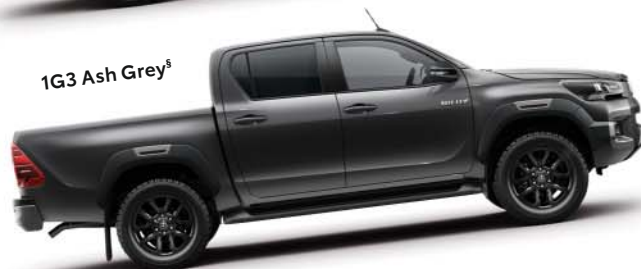
1G3 Ash Grey §