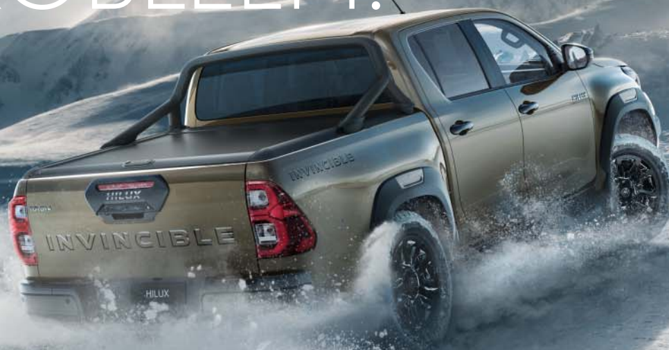
Afgebeeld: Hilux Invincible