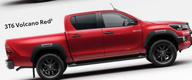
3T6 Volcano Red §