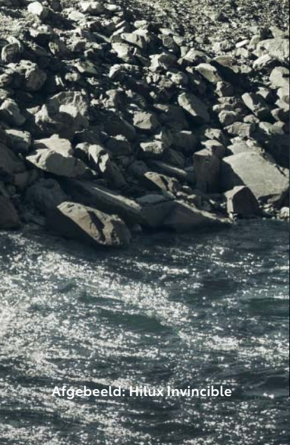
Afgebeeld: Hilux Invincible

Omdat de Hilux is gemaakt om te werken in de meest extreme omgevingen, kunt u blindvaren op zijn legendarische kwaliteit, duurzaamheid en betrouwbaarheid. Met een onverwoestbaar chassis, een bodemvrijheid van 700 mm en uitzonderlijke veerweg vormt zelfs het zwaarste terrein geen obstakel. Componenten hebben een uniek design dat met intensieve rijtests gedurende meer dan vijftig jaar werd fijngeslepen. Het resultaat: een uniek voertuig. Ontworpen en gebouwd als geen enkele andere pick-up.