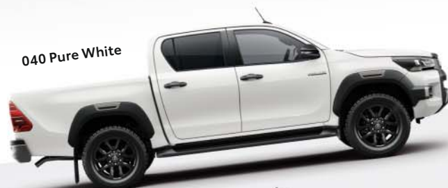
040 Pure White